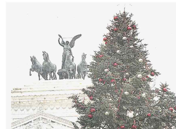
MALTEMPO A sinistra, gli alberi devastati in Trentino; sopra, l'albero di Piazza Venezia a Roma ribattezzato Speraggio