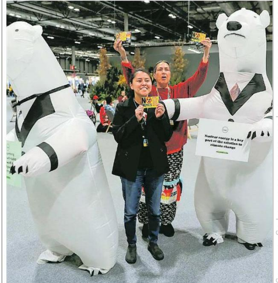
▲ Attivisti anti-nucleare di fronte uno stand pro energia atomica al Cop25